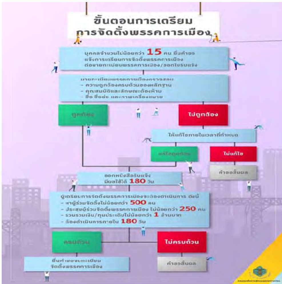
ภาพที่ 1 ขั้นตอนการเตรียมการจัดตั้งพรรคการเมือง